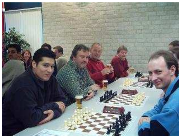
De beslissende wedstrijd tegen LSG 1.